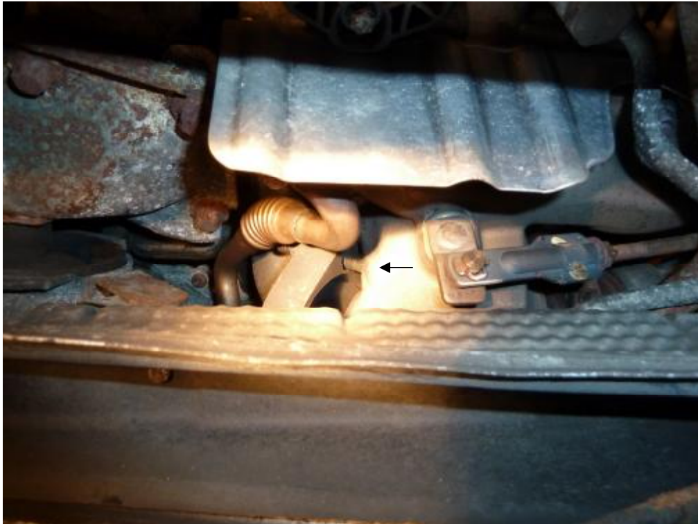
Abgaskrümmer vom Turbolader abgerissen