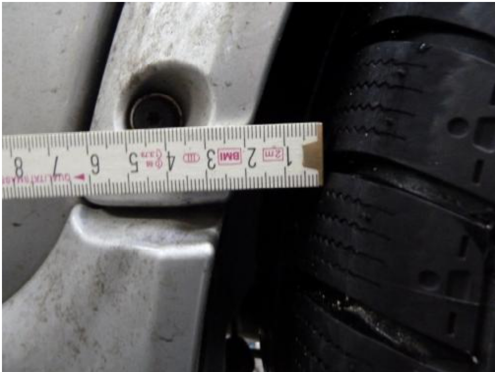
Hinterrad links zu einem Fixpunkt mit Abstand rd. 24 mm