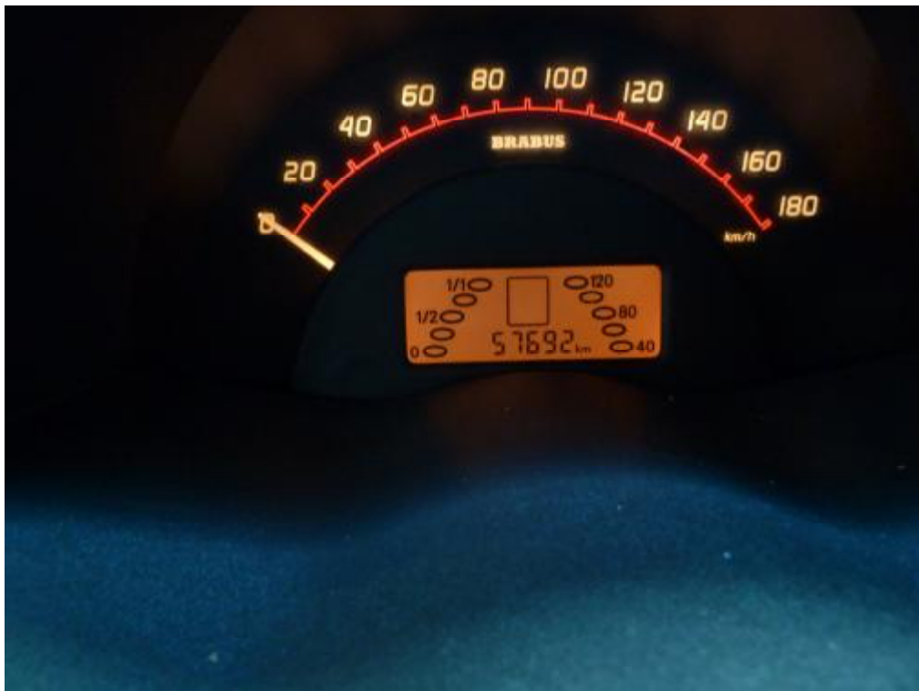
Tachostand: 57692 Km