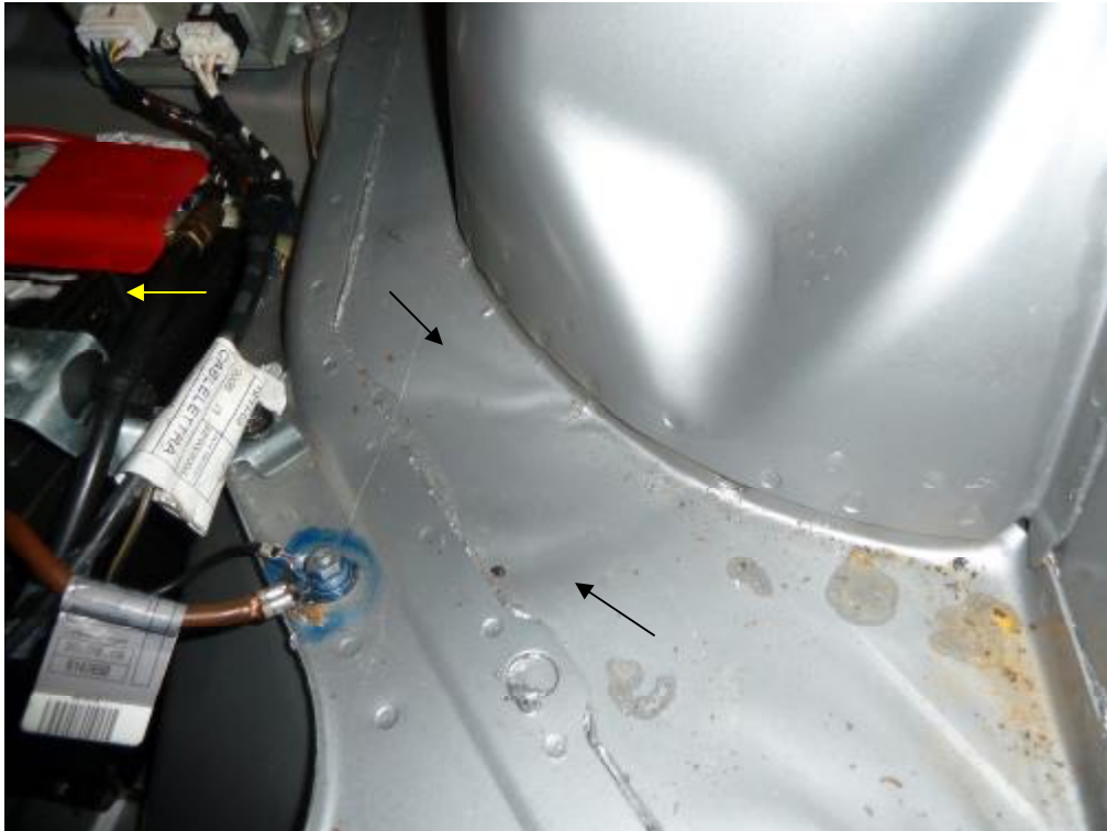
Fußraum rechts mit Verzugsdellen, Starterbatterie lose