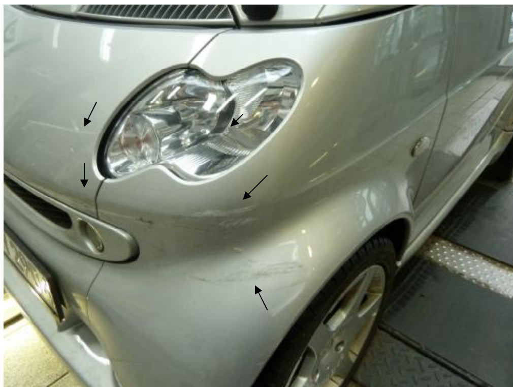
Vorn links: Kotflügel, Hauptscheinwerfer, Front eingekerbt