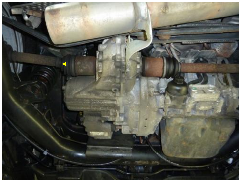
Antriebswelle links verschoben