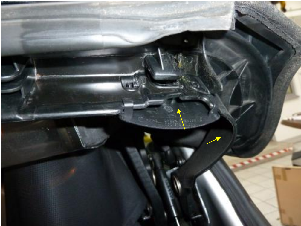
Verdeckriegel hinten rechts abgerissen, Gestänge verbogen