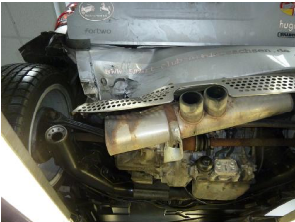
Heckbleche und Antriebsaggregate nach vorn geschoben