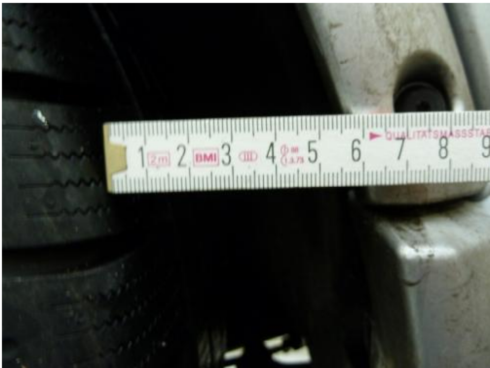
Hinterrad rechts mit Abstand zum Fixpunkt wie links rd. 61 mm