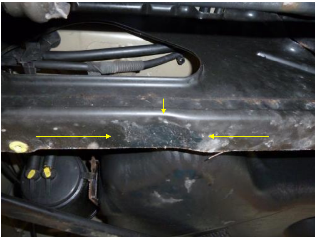
Querträger gestaucht und geknickt