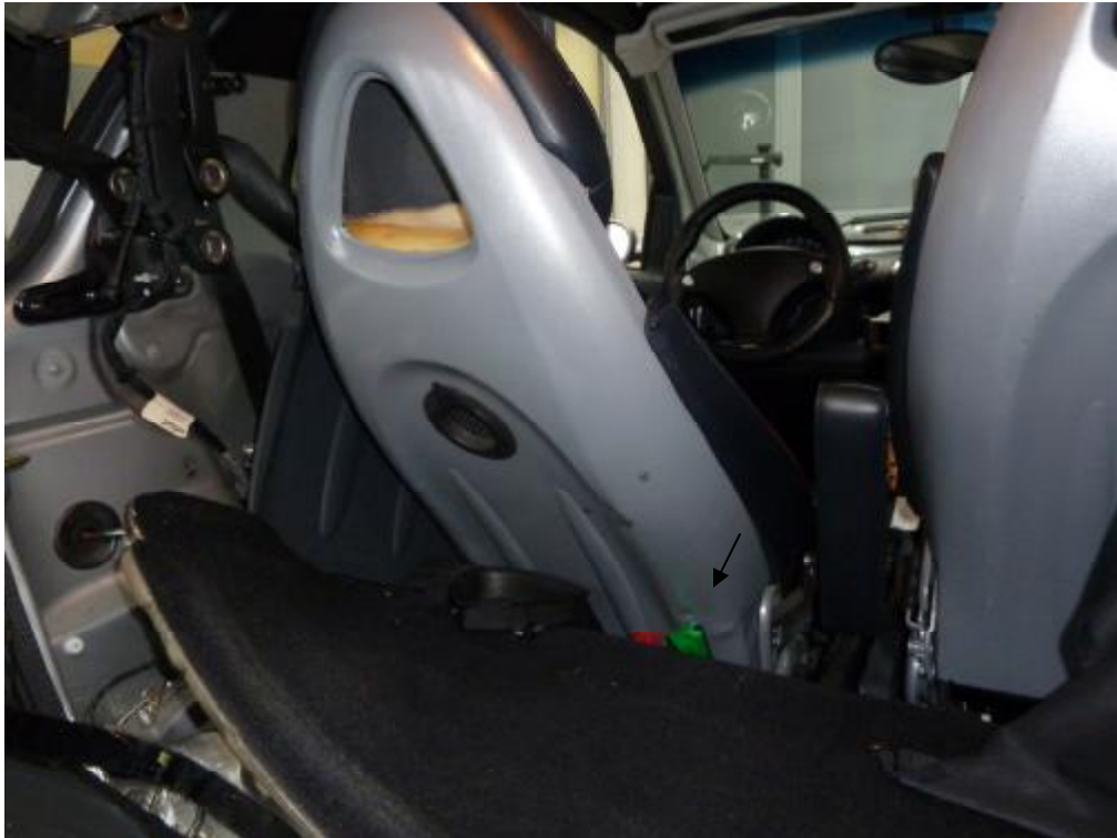
Fahrersitzlehne deformiert, Innenverkleidungen gelöst