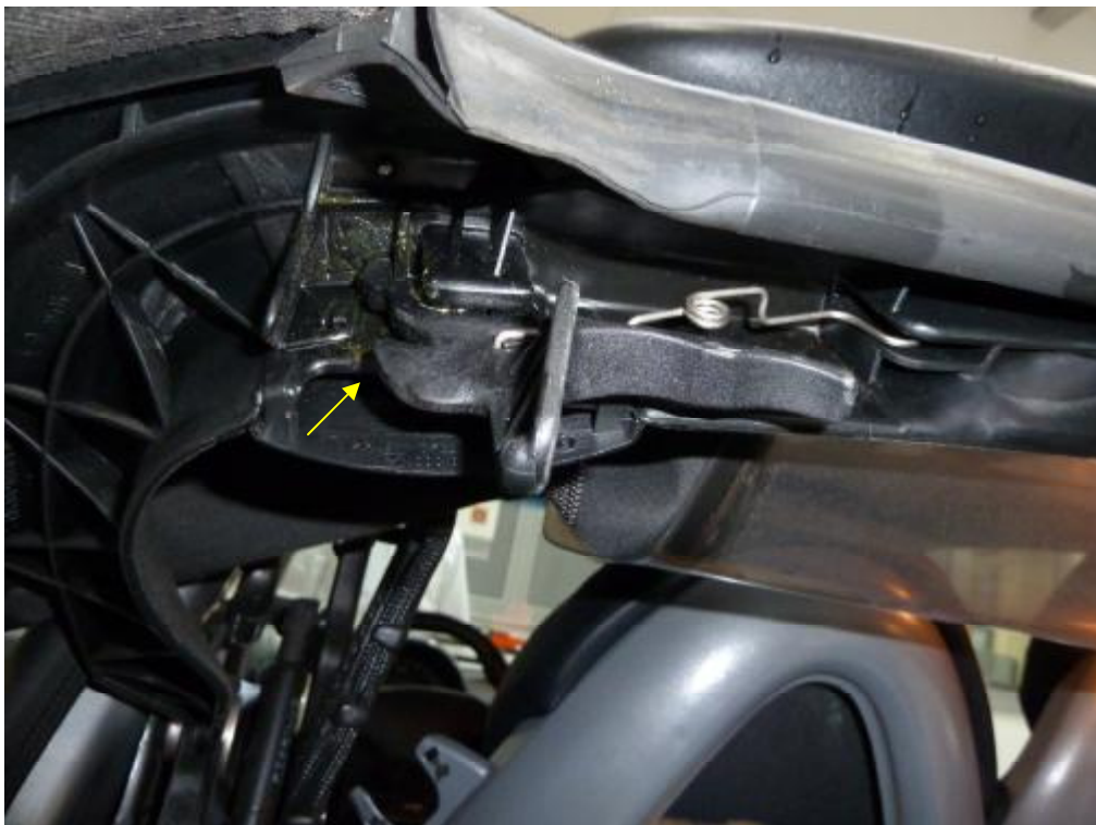
Verdecksituation hinten links, Riegel ohne Funktion