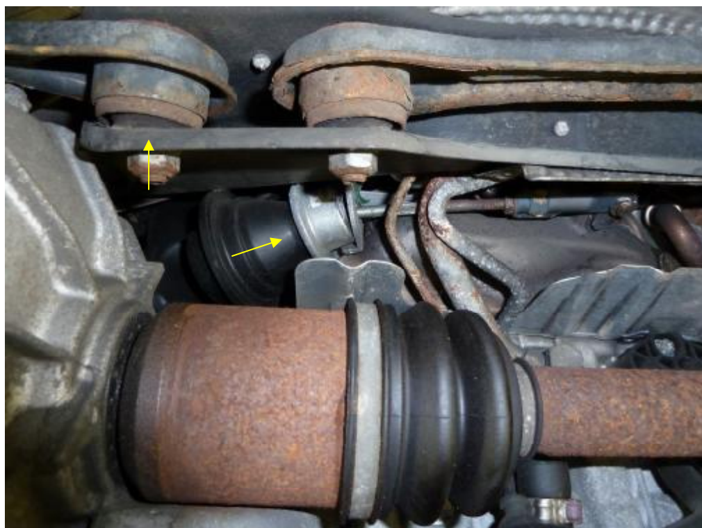
Verbogene Traggelenke, Unterdruckdose gebrochen