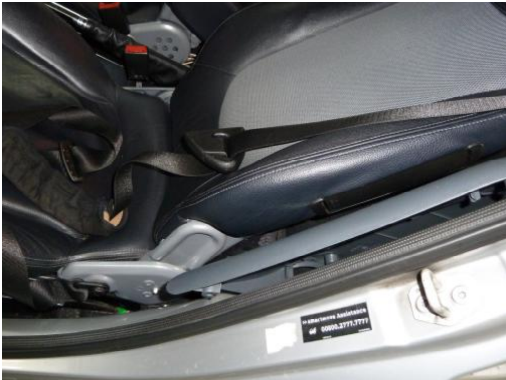
Fahrsitz nach hinten verbogen, Sicherheitsgurt funktionslos