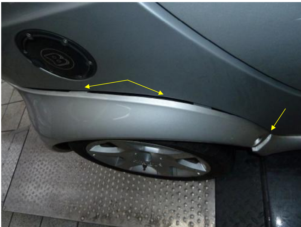
Verschiebungen am Hinterwagen rechts