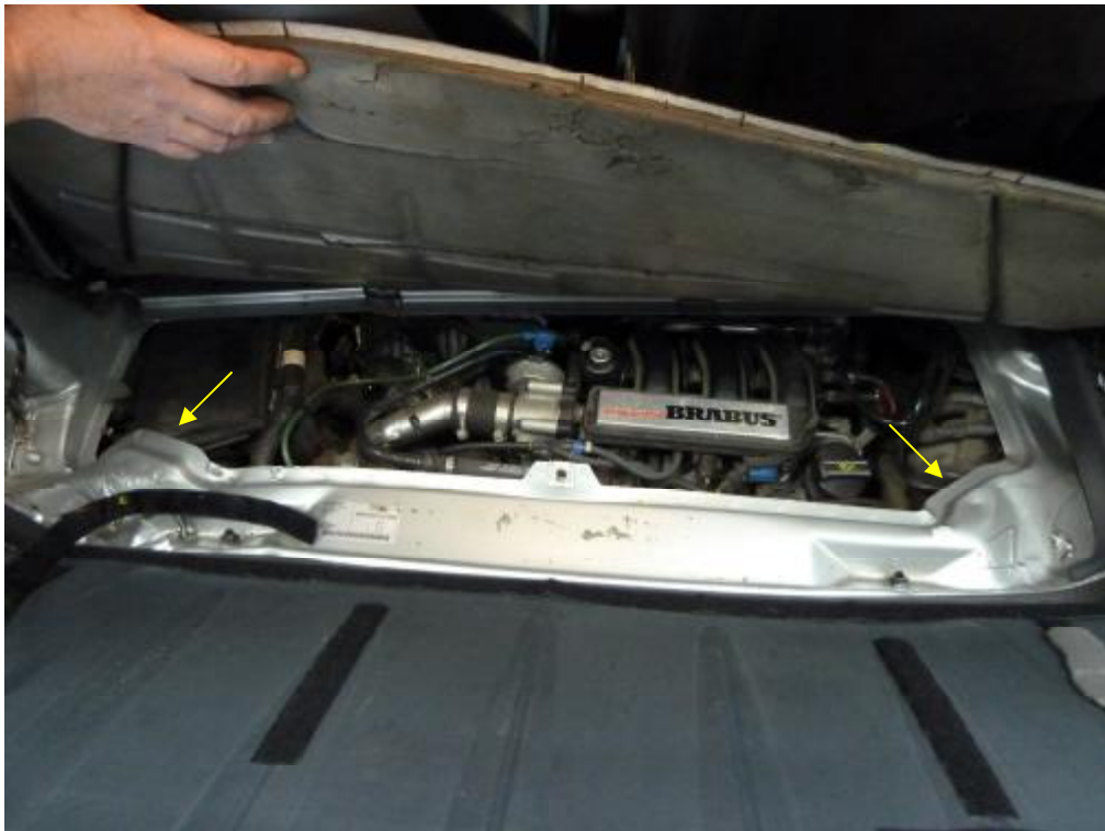
Heckabschlussblech links und rechts geknickt und gegen den Motor geschoben